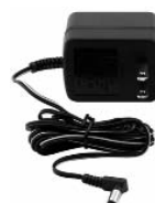
ADAPTADORE DE CARGA CA

Recargar la batería luego de cada uso prolongará la vida de la batería; las descargas importantes frecuentes entre recargas o el cargarla en exceso reducirán la duración de la batería. La batería se puede recargar utilizando un adaptador de CA (demostrado).